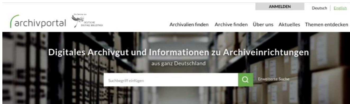
Suchschlitz Archivportal-D, neues Design (Screenshot)

Zur Umsetzung der neuen Themenzugänge war ein umfassendes Re-Design des bisherigen Archivportals-D erforderlich