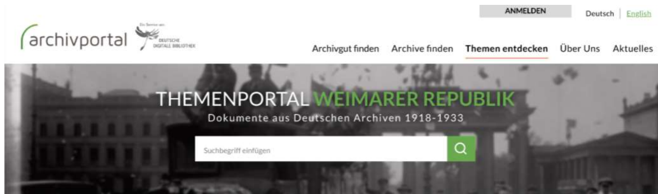
Suchschlitz Themenzugang „Weimarer Republik“ (Screenshot)

https://xd.adobe.com/view/c02a1f37-88e8-4500-7980-8a83c6a1466d-b61b